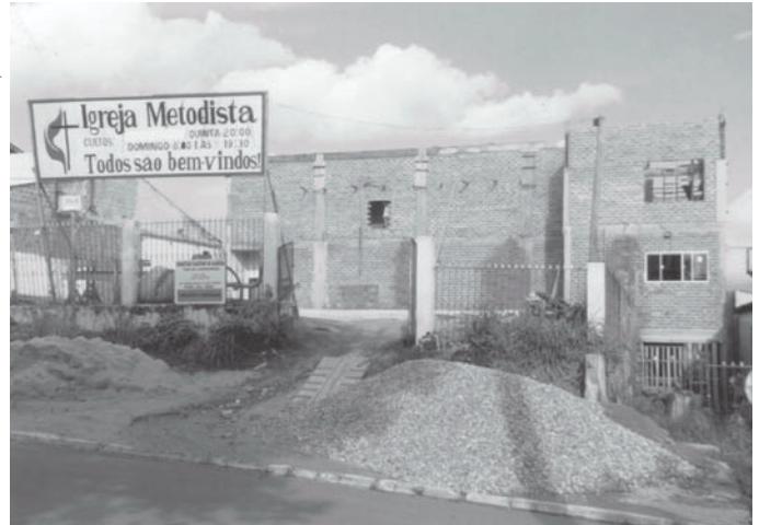
Cacoal, RO, recebe recursos para finalizar a construção do templo

portância da oferta para o projeto missionário da Igreja Metodista. Segundo o secretário executivo, a configuração conexional da Campanha de Oferta Missionária, que integra todos as Regiões e igrejas buscando alcançar um alvo pré-estabelecido, estimula a parceria em perspectiva bíblica e wesleyana. “O sistema conexional é característica fundamental e básica para a realização da missão metodista” – conclui o secretário.