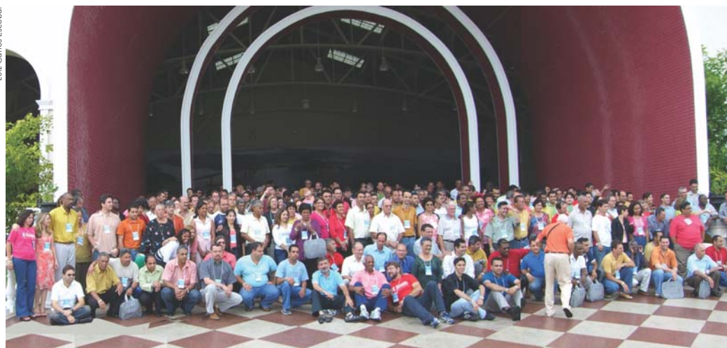
O Concílio realizou-se no Sesc Aracruz, o lugar será palco do Concílio Geral 2006