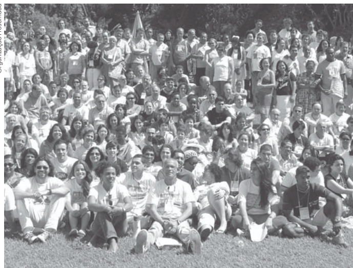
Jornada refletiu sobre o Movimento Ecumênico hoje na realidade latino-americana, caribenha e internacional.

cuidado, em favor uns dos outros” (1 Coríntios 12,25), superando divisões e subtraindo distâncias, semeando a multiplicação de solidariedade, justiça e paz , resposta presente à oração do Mestre: “para que todos sejam um” (João 17.11).