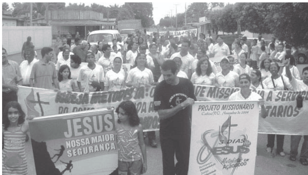
Em 2005 a Campanha de Evangelização incentivou a missão nas Regiões