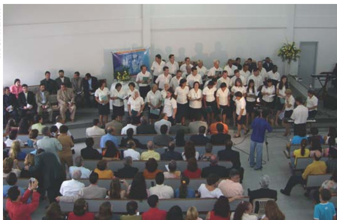
O culto de encerramento realizou-se na Igreja Metodista em Itapuã, Vila Velha