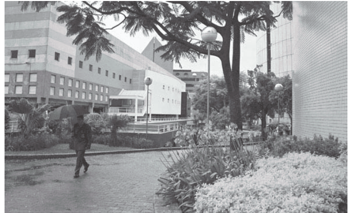
Cepuc: local que receberá o evento em Porto Alegre

O trabalho de preparação da 9ª Assembléia é conduzido pelo Comitê de Planejamento da Assembléia (APC) e pelo Comitê de Liturgia da Assembléia (AWC), sob a supervisão do Comitê Central do CMI. Esses comitês se reúnem regularmente antes do início da Assembléia. O evento é coordenado pelo escritório da Assembléia em Genebra e por um coordenador local em Porto Alegre.