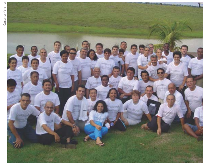
Ministerial contou com a participação de todos os pastores e pastoras