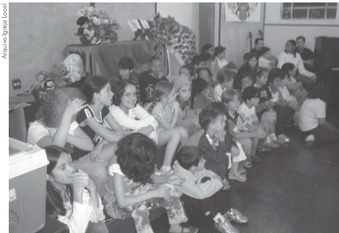
Igreja realiza vigília pelas crianças

Uma iniciativa pioneira da Vila Isabel, que esperamos venha a ser seguida por muitas outras igrejas.